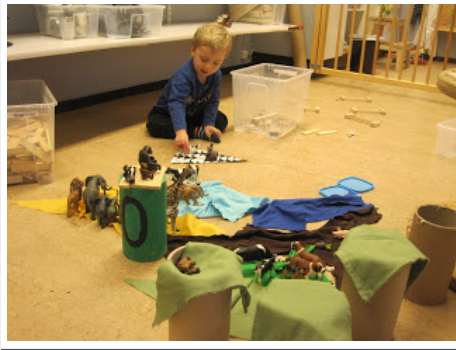
Este tipo ha hecho escenario para animales de la selva. , árboles finos seguro?