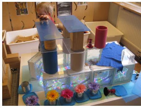
Un hermoso mar construida de bloques de vidrio de luces, cubiertas de plástico, latas, flores de seda, de plexiglás y tubos de papel.