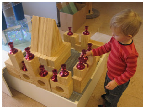
Aquí se construyó un castillo con torres y torreones. Está decorado con candelabros torneadas.

Nuevos materiales de construcción! construcción de barcos y bâtek.