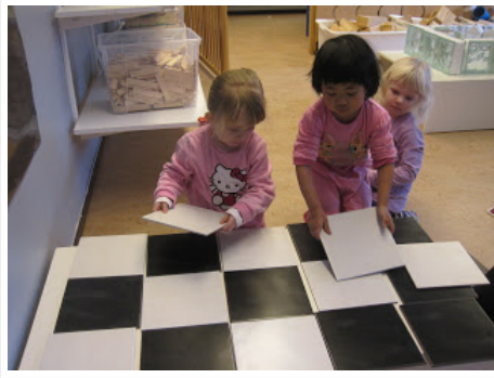
Las chicas se ayudan entre sí para poner azulejos! No, no en el piso, pero añaden patrón de baldosas cerámicas antiguas.